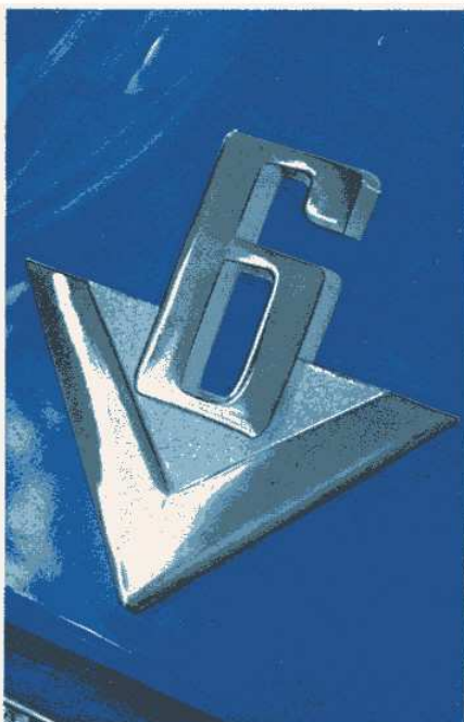
V6 – Symbol für Temperament

front strömt kühle Frischluft in den Wagen. Ob viel oder wenig, links, rechts, oben oder unten – das bestimmen Sie. Der Taunus 20 M ist ein Auto der großen 2-Liter-Klasse. Sie haben Anspruch darauf, daß er Ihnen den Komfort dieser Klasse bietet. Sie werden überrascht sein, wie er Ihre Erwartungen noch übertrifft.