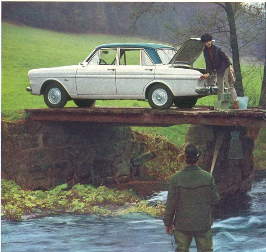
Natürlich können Sie ihn mit vier breiten Türen haben