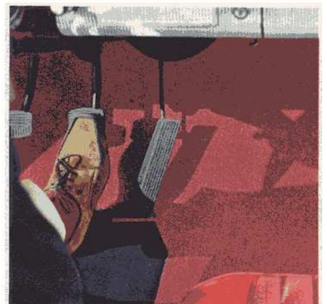
Fußfreiheit auf ebenem Wagenboden