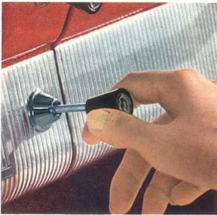
Eine Heizung, die wirklich durchheizt

Vorteil für Sie. Klein dagegen sollen die Kosten sein. Und sie sind's beim wirtschaftlichen Taunus 12 M. Er braucht nur 7,5 Liter für 100 km (nach DIN). Und die bewährte Lebensdauer des V4-Motors spielt auch eine Rolle, wenn's ums Geld geht. Ein Motor, bei dem Sie vor bösen Überraschungen sicher sind. Ein Motor, der Sie nie im Stich lassen wird.