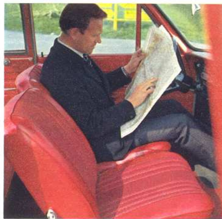
Sportliche Einzelsitze beim Taunus 12 M TS