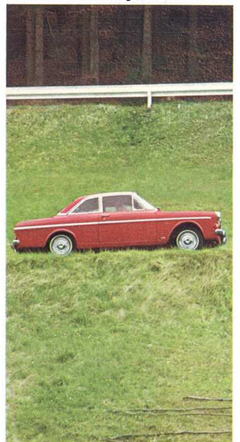
Taunus 12 M Coupé – sportlich und schnell