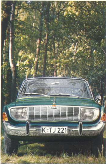
Breitspur bedeutet Sicherheit

Denn die Kurvenneigung wird geringer. Das Breitspurfahrwerk des Taunus 17 M und Taunus 20 M hat einen neuen Maßstab gesetzt. Verzichten Sie deshalb in Ihrem eigenen Interesse auf nicht einen Zentimeter Spurbreite. Genauso wenig wie auf den Platz für vier breite Türen.