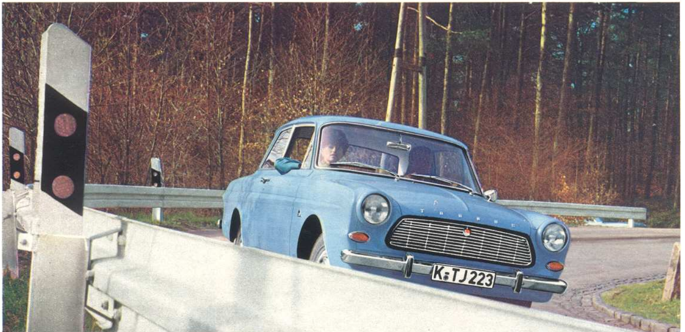
Sicher und zuverlässig auf jeder Straße, in jeder Kurve