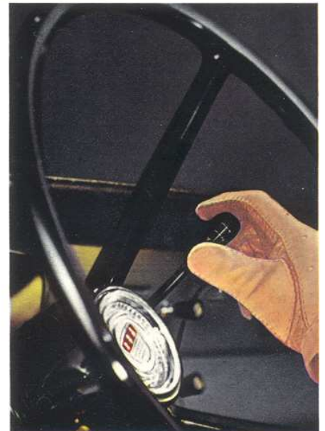
Mit leichtgängiger Schaltung